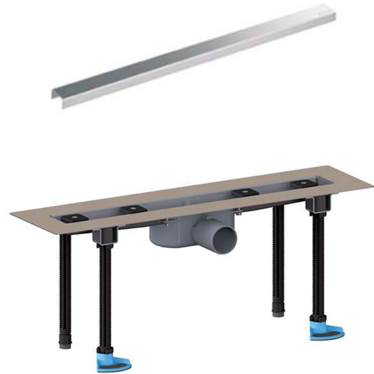
Душевой лоток HL50FU (HL50FU.0)