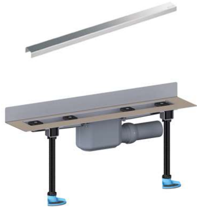
Душевой лоток HL50W (HL50W.0)