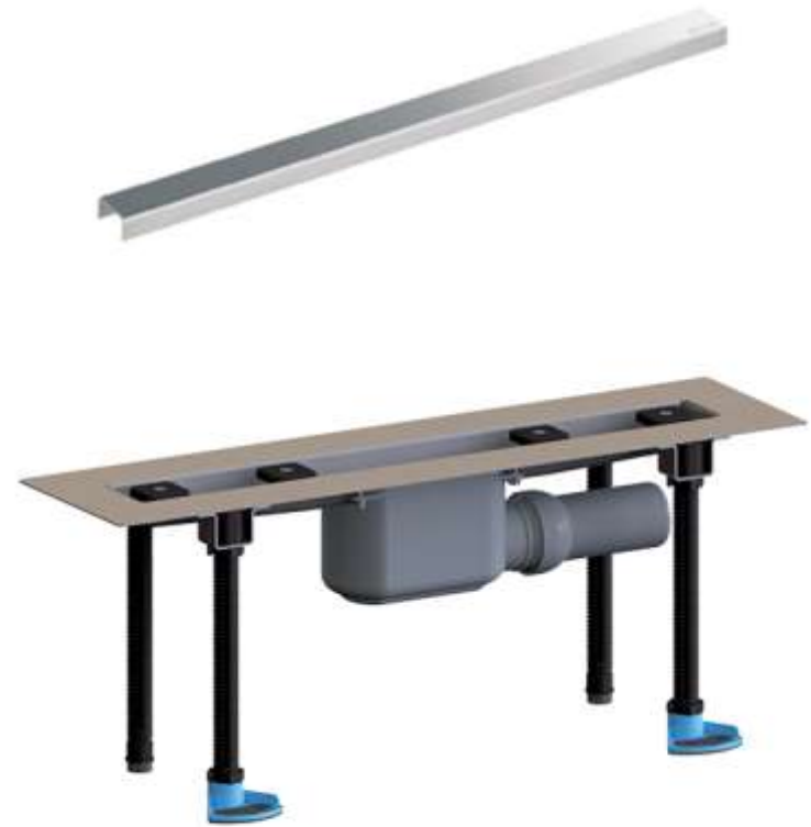
Душевой лоток HL50F (HL50F.0)